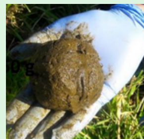
Fig.1 : échantillon d'excréments